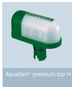
AquaGen® premium.top H

Für Kapazitäten bis 340 Ah sowie für Anwendungen mit abmessungsbedingten Einschränkungen (wie Höhe in Bezug auf die Batterieaufstellung sowie Tiefe in Bezug auf das Zellenmaß) ist die Ausführung AquaGen® premium.top H verfügbar.