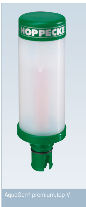
AquaGen® premium.top V

Der AquaGen® premium.top-Rekombinator wird als externes Bauteil auf der Batterie installiert. Dadurch wird ein Temperaturanstieg in der Batterie ausgeschlossen. Die Trennung der Rekombination von den aktiven Bauteilen der Batterie ermöglicht die Reduzierung des Wartungsaufwandes analog zu verschlossenen Batterien, ohne Reduzierung der Gebrauchsdauererwartung und ohne Einschränkung der Betriebsbedingungen.